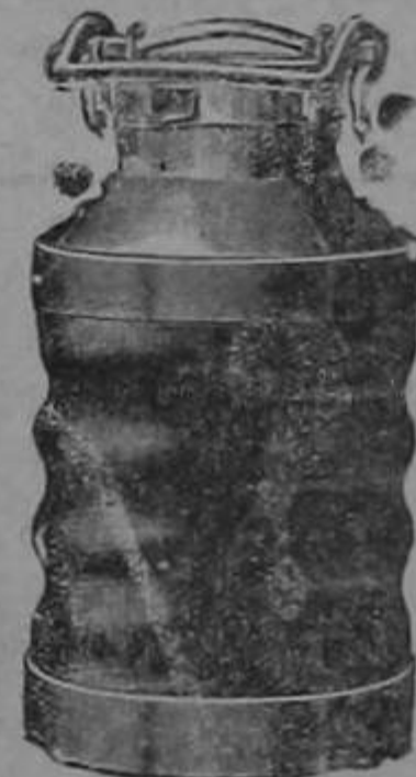
pintuas Al.bastin etc.

CATRES Americanos grandes y pequeños. Felpudos Mangueras alambradas.